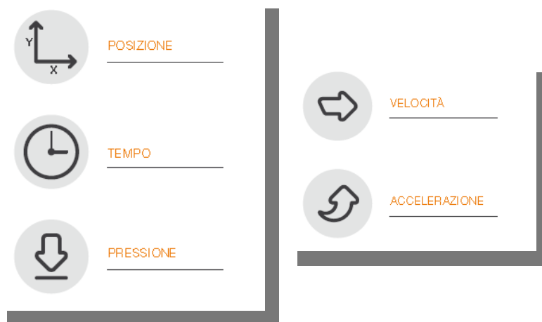
Fig.1 - Schema

E' possibile elaborare velocità e accelerazione ai fini di analisi forensi.