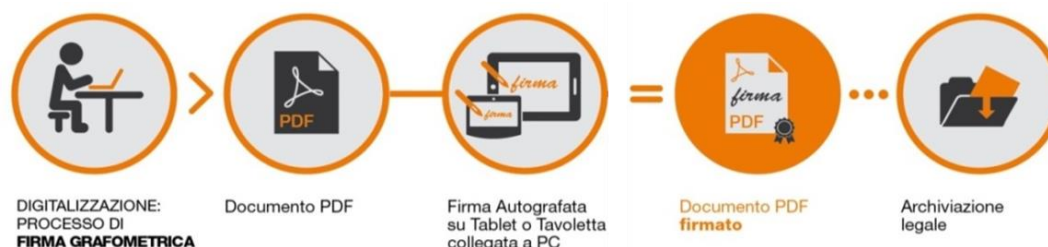
Fig.2 - Schema

I dati cifrati vengono successivamente inseriti nel pdf attraverso la creazione di una firma conforme allo standard europeo denominato PAdES. La soluzione prevede che, a sigillo di ogni firma apposta sul documento dal CLIENTE, sia applicato un certificato rilasciato da NAMIRIAL CA.